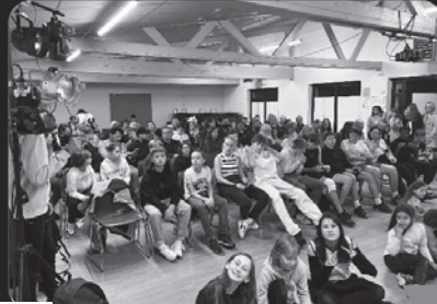
Le public était présent lors de la présentation des courts métrages au festival Echos Fracas