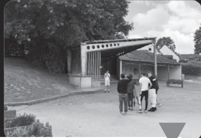
Les jeunes en plein Tournage du film « phénomène » début juillet dans l'enceinte de l'école.

Retour sur Le projet « Tomber les Murs » : 2 courts métrages réalisés avec l'espace jeunes et la compagnie « A CorpsRompus » présentés au festival Echo/Fracas.