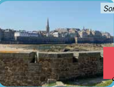
Sortie St Malo