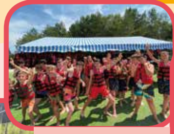
Sortie West Wek Park