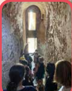
Visite Fort National à St Malo