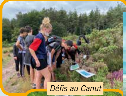
Défis au Canut