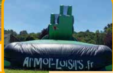
Fun et sensation à Pont Réan