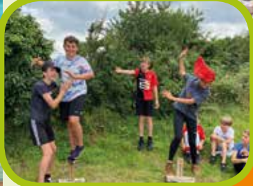
Grand Kholanta au Canut