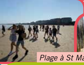
Plage à St Malo