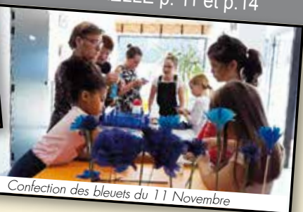
Confection des bleuetts du 11 Novembre