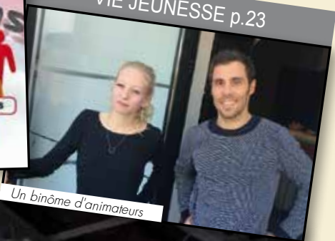
Un binôme d'animateurs