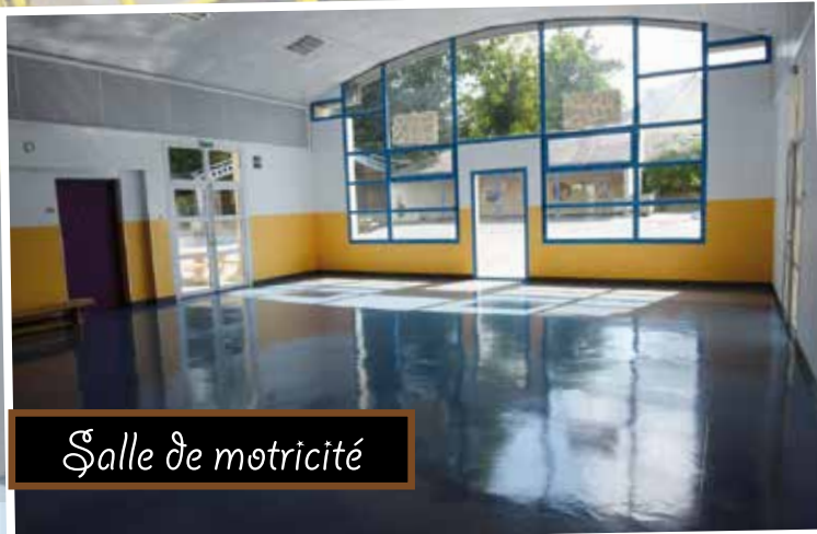
Salle de motricité

La municipalité prend en charge toute la logistique de l'école primaire publique, maternelles comme élémentaires. Elle doit ainsi veiller au bon fonctionnement des bâtiments qui accueillent les écoliers, et permettre l'accès à du matériel pédagogique adapté aux méthodes utilisées. A Lassy, les enfants, les parents, les professeurs et le personnel municipal encadrant ont fait une rentrée dans des locaux fonctionnels et agréables. Travaux de rafraîchissement et d'entretien dans les bâtiments