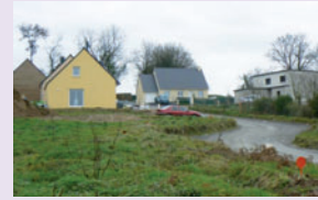
Le Clos de la Noé

ainsi que la réfection de la route de l'Oliverais.