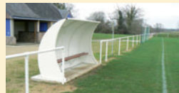
La lisse et les bancs de touche

Cette année, les lisses et les bancs de touches du terrain de football ont été entièrement refaites .