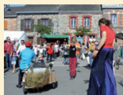
Parade du 28 mai 2011

Cette année, les lisses et les bancs de touches du terrain de football ont été entièrement refaites .