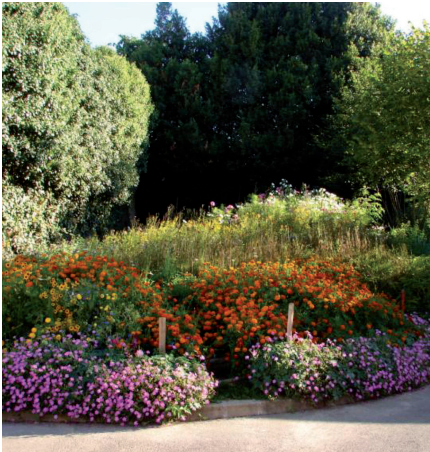
Un magnifique jardin à Lassy, photo réalisée par M. Lacombe.