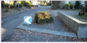
aménagement lotissement de la Touchette

Dans le cadre de l'aménagement et du cadre de vie, un jardin public , lieu de rencontre, a été ouvert et sera étoffé de nouveaux jeux pour le printemps prochain.