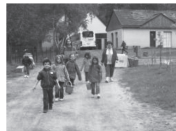
Atelier mare proposé en classe verte !

Des cours de poney et d'équitation (enfants, adolescents, adultes), promenades, goûters d'anniversaire sont proposés sur le site par le centre équestre des Mille Fossés (contactez David au 06 77 13 03 24). Le poney club propose des cours d'équitation réguliers (à raison d'une heure par semaine)