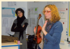
Remise des instruments

Un vif succès pour le projet de lecture pour les tous petits de 0 à 3 ans mis en place par l'équipe de la bibliothèque durant le dernier trimestre 2011, ce projet continuera en 2012.