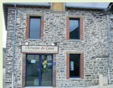
L'échoppe du Canut

ment de l'activité commerciale le vendredi soir.