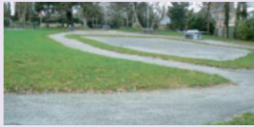
le jardin public