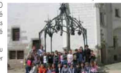
Texte écrit par les élèves de CE2, pour « Le Lien »

autour du chantier. L'éléphant a arrosé les CM2. Ça c'était vraiment très marrant. Puis nous sommes rentrés épuisés à Lassy, mais heureux de cette belle journée.