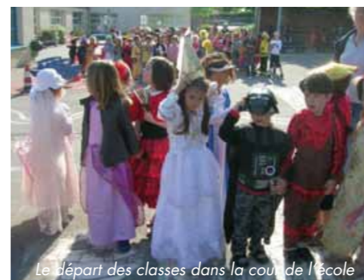
Le départ des classes dans la cour de l'école

Comme chaque année, les élèves de toutes les classes ont participé au traditionnel défilé du carnaval dans les rues de Lassy, par une belle matinée ensoleillée.