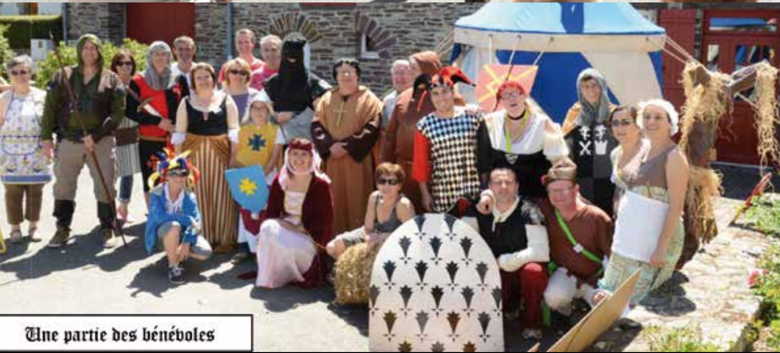
Une partie des bénévoles