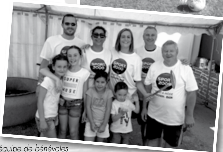
équipe de bénévoles