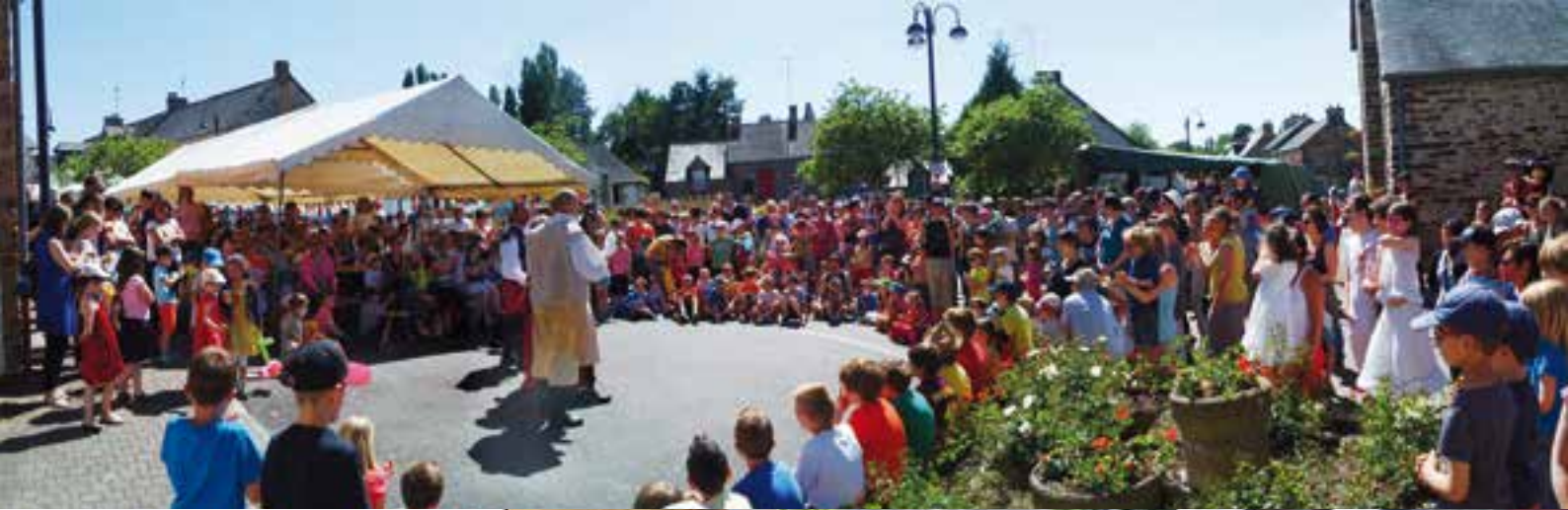
Une interaction avec le public