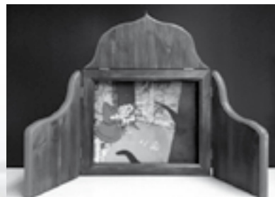
Le Kamishibai est un théâtre d'images.

Un coffret de bois posé sur une table...un, deux, trois volets s'ouvrent pour découvrir une image encadrée ! Ces illustrations racontent une histoire, chaque image présentant un épisode du récit. Une fenêtre ouverte sur le rêve et l'imaginaire...des images qui se suivent et racontent une histoire. Quelle merveille !